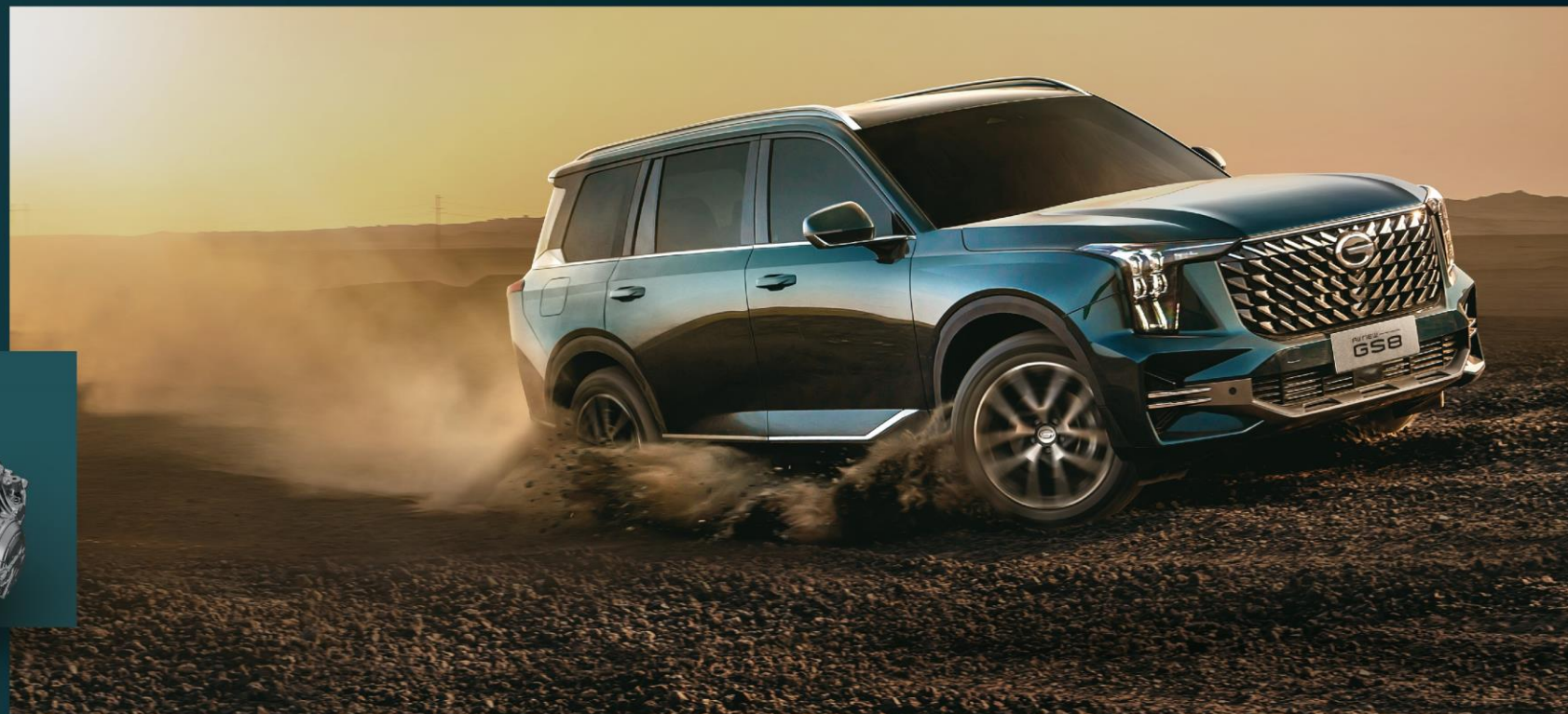
TRANSMISIÓN AISIN DE TERCERA GENERACIÓN DE 8 VELOCIDADES (8AT).