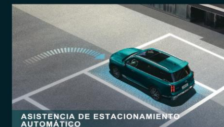
ASISTENCIA DE ESTACIONAMIENTO AUTOMÁTICO

LA TECNOLOGÍA DE VANGUARDIA REDEFINE LO INTERACTIVO Y DESATA INFINITAS POSIBILIDADES