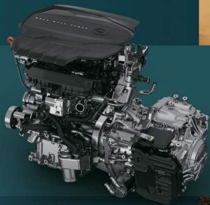
MOTOR POTENTE 2,0T DE GASOLINA CON INYECCIÓN DIRECTA