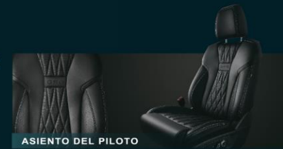
ASIENTO DEL PILOTO

LOS ASIENTOS DE LA SEGUNDA TECNOLOGÍA DE CONTROL NHV (RUIDOS, VIBRACIONES Y ASPEREZAS).