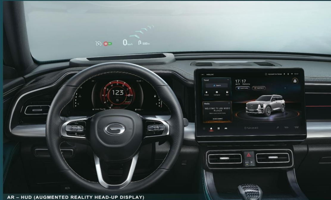
AR - HUD (AUGMENTED REALITY HEAD-UP DISPLAY)